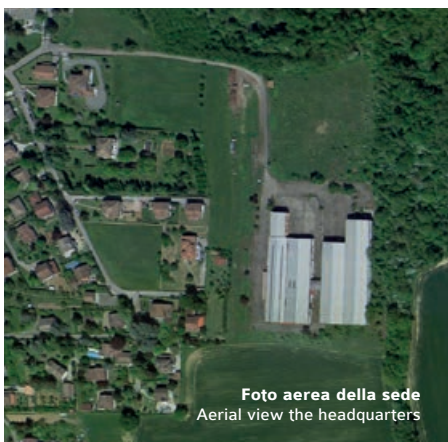
Foto aerea della sede Aerial view the headquarters

In addition, for the purpose of enabling the most accurate and competent analysis of painting products, since 2008 our company is an ordinary member of the PROCOAT consortium for painting products, and consequently it can rely on qualified laboratories which can perform all kinds of analyses in accordance with ISO parameters.