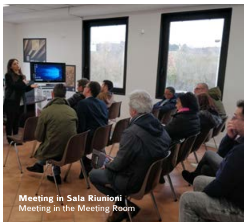
Meeting in Sala Riunioni Meeting in the Meeting Room