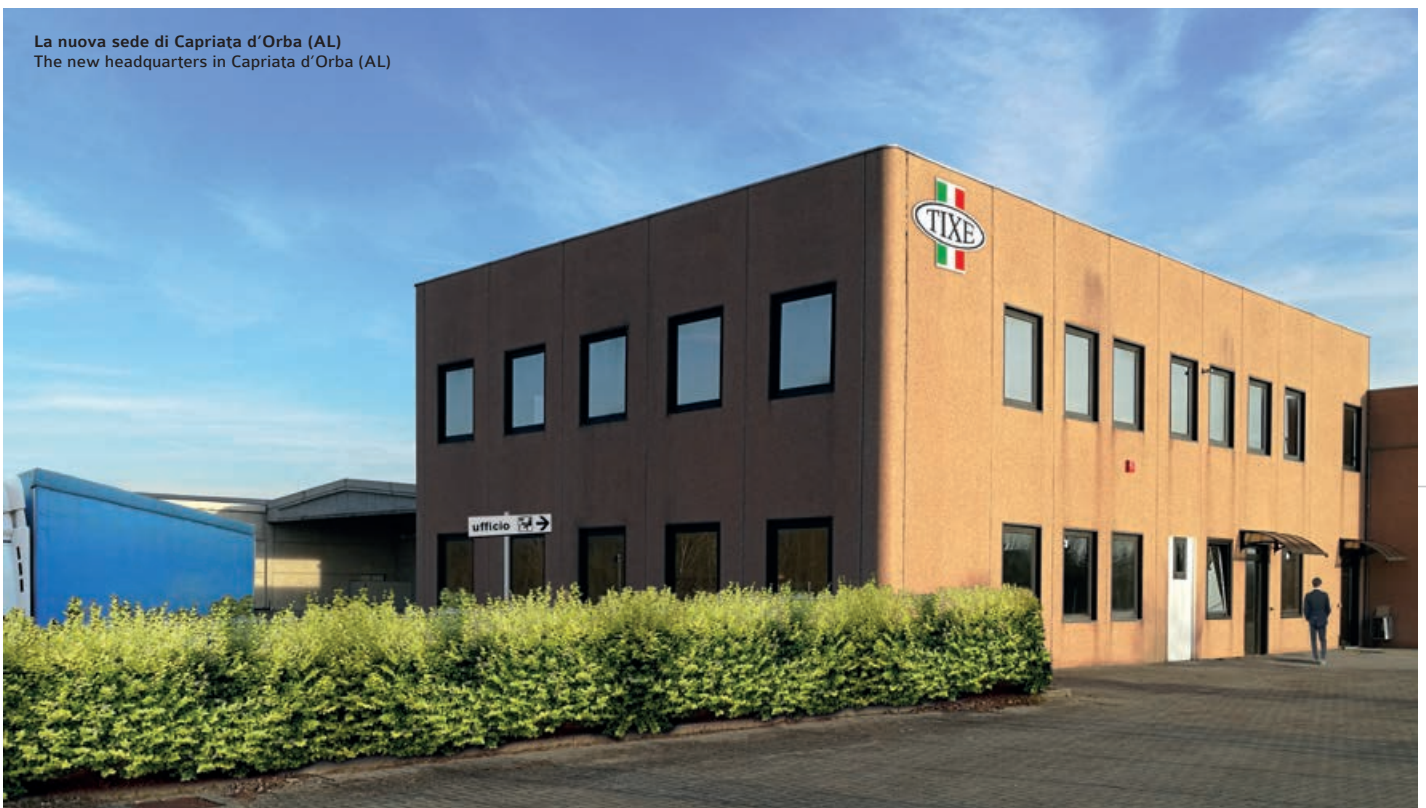
La nuova sede di Capriata d'Orba (AL) The new headquarters in Capriata d'Orba (AL)

The company continues to expand, it was moved to its current headquarters in Capriata d'Orba (AL), wider with a covered area of 8,000 sq m. and in a strategic position. This the result of an experience spanning several decades, during which the company gradually focused on a constantly expanding market , both with regards to the technical aspects and with specific reference to the growing requirements for documented product quality .